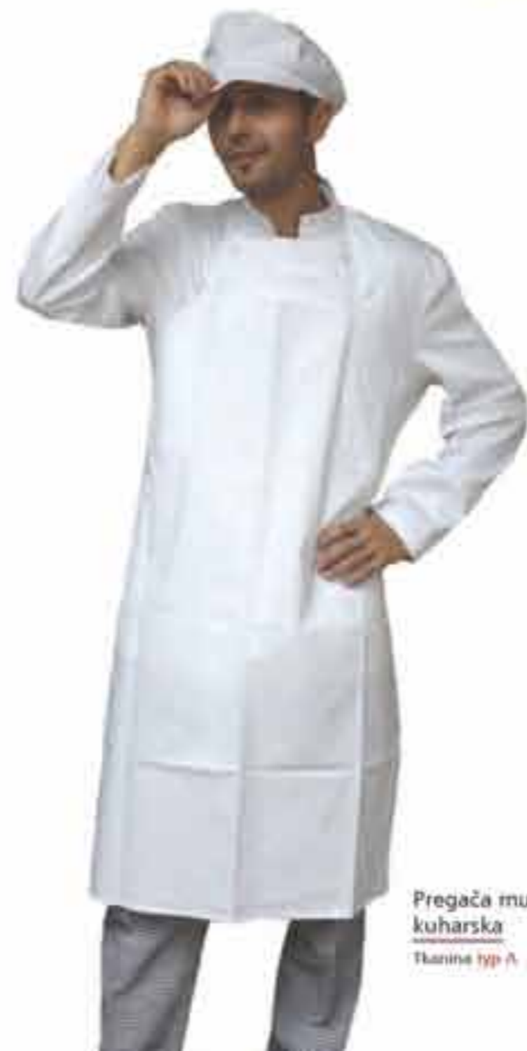
Pregača muška kuharska