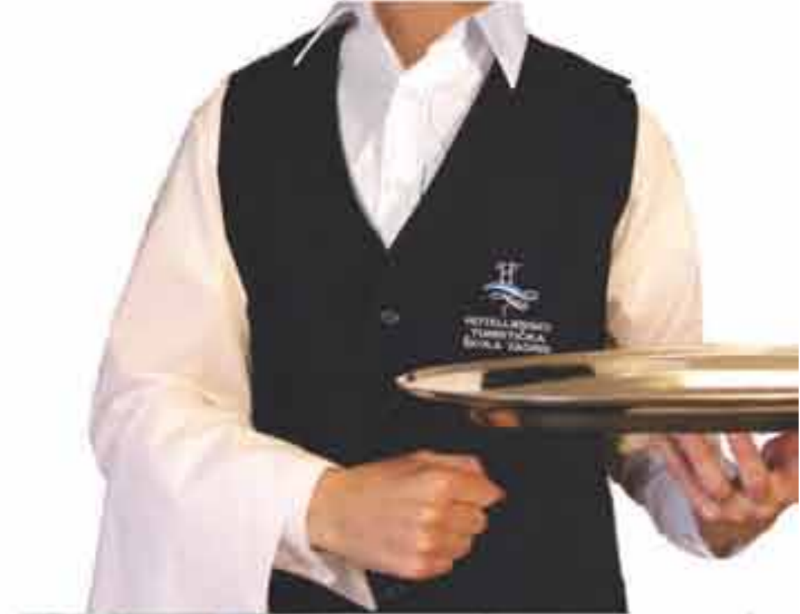
Prsluk muški "Renato" Vel 46-62 Tkanina tip G