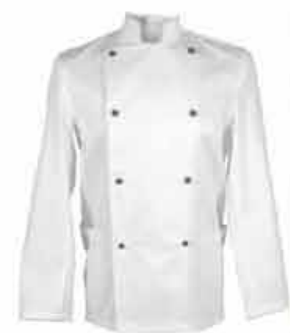
Bluza muška kuharska (gumbi na skidanje)