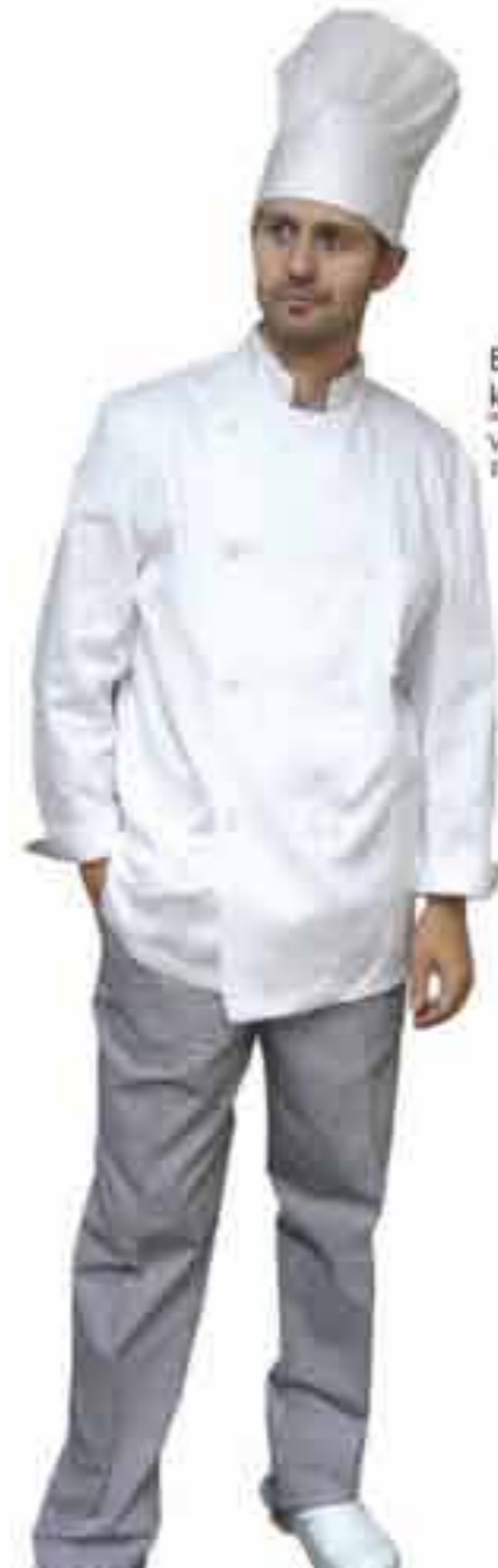
Kapa kuharska – visoka