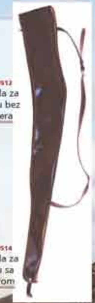
Art 800514 Futrola za pušku sa spužvom