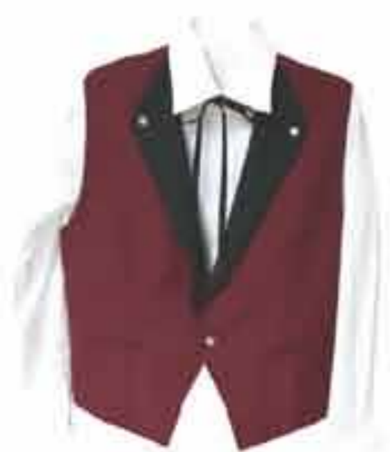
Prsluk muški "Rino" Vel 46-62 Tkanina tip G