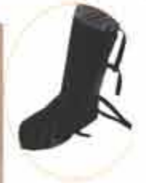
Art 800690 Zaštitna varilačka potkoljenica s čeličnom kapičom Prirodna koža