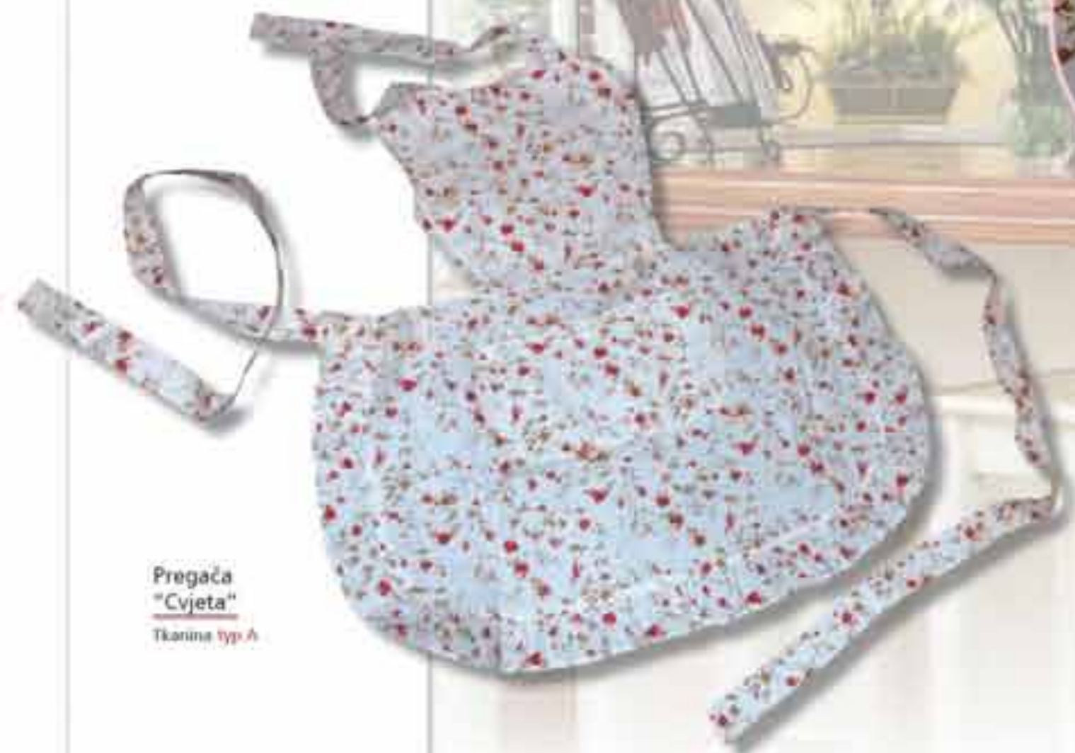
Pregača "Cvijeta" Tkanina tip A