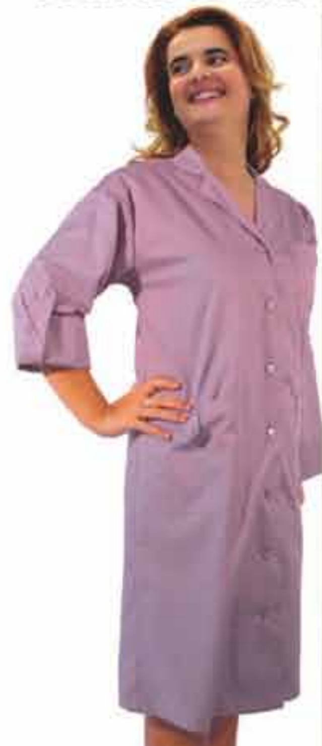
Ogrtač "Ivanka" Vel 36-54 Tkanina tpy II