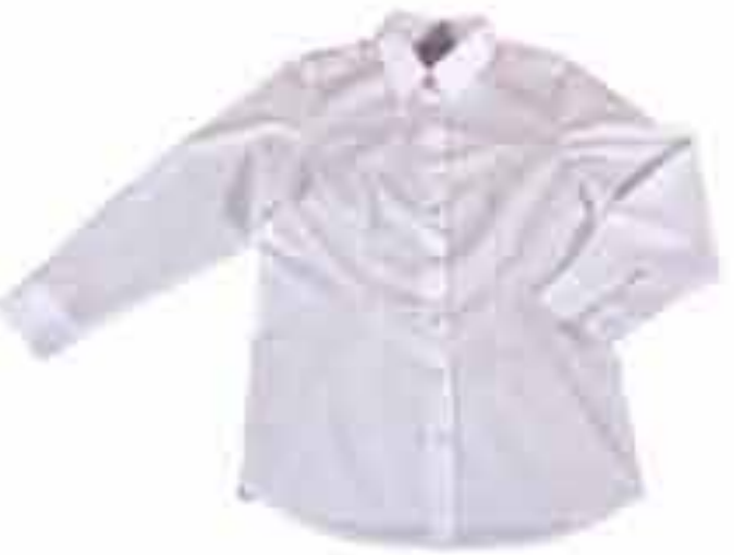
Bluza ženska "Verica" Vel 36-46 Tkanina tip A