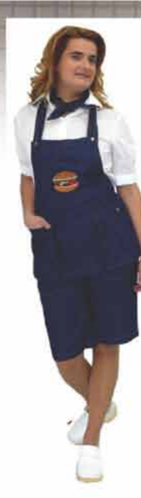
Pregača ženska "Lj" Izazina tip A (traper)