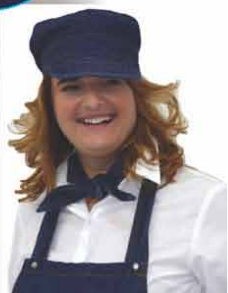
Marama ženska "Lj" Izazina tip A (traper)