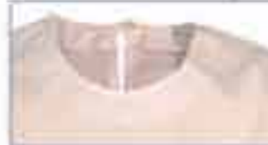
Bluza ženska "Justa" Vel 36-44 Tkanina tip A