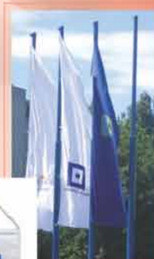
Zastave vanjske, štampane