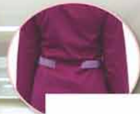
Tunika "Zdravka" Vel 36-54 Tkanina tpy II