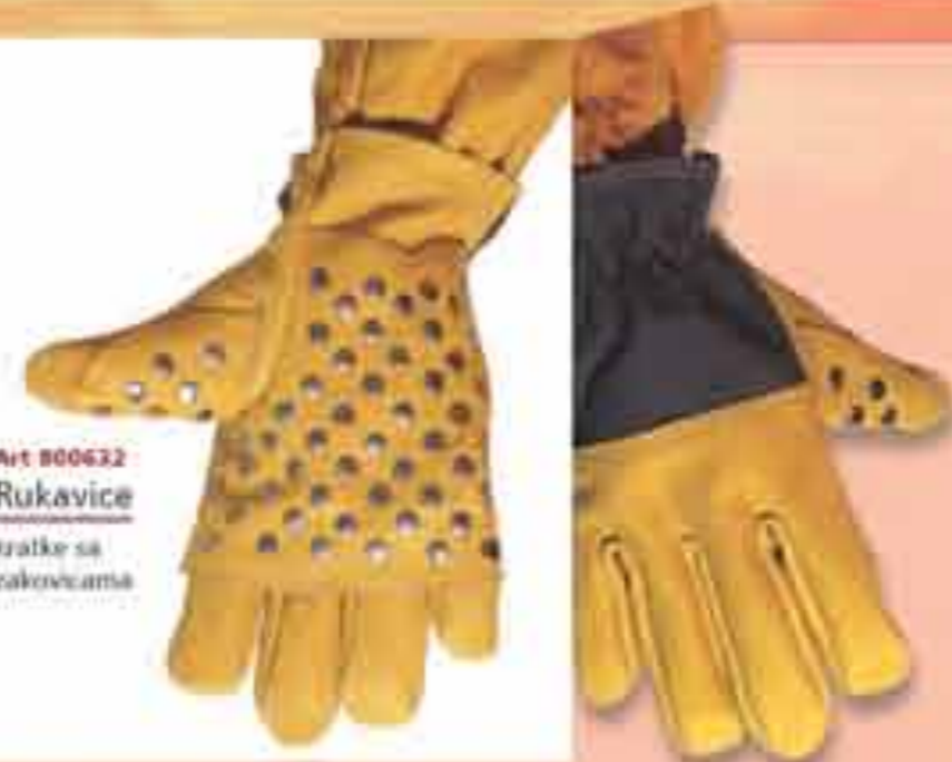
Art 800632 Rukavice kratke sa zakovicama