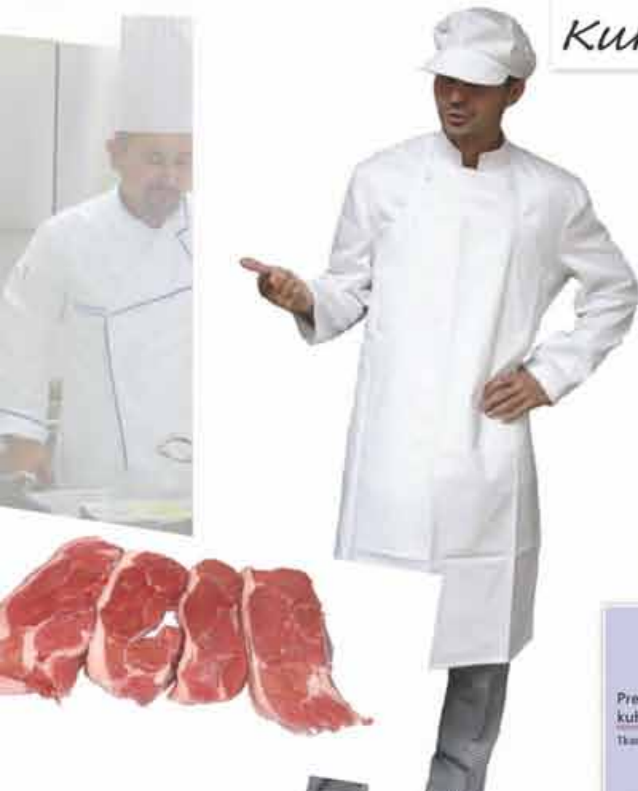
Pregača muška kuharska Tkanina tip 1