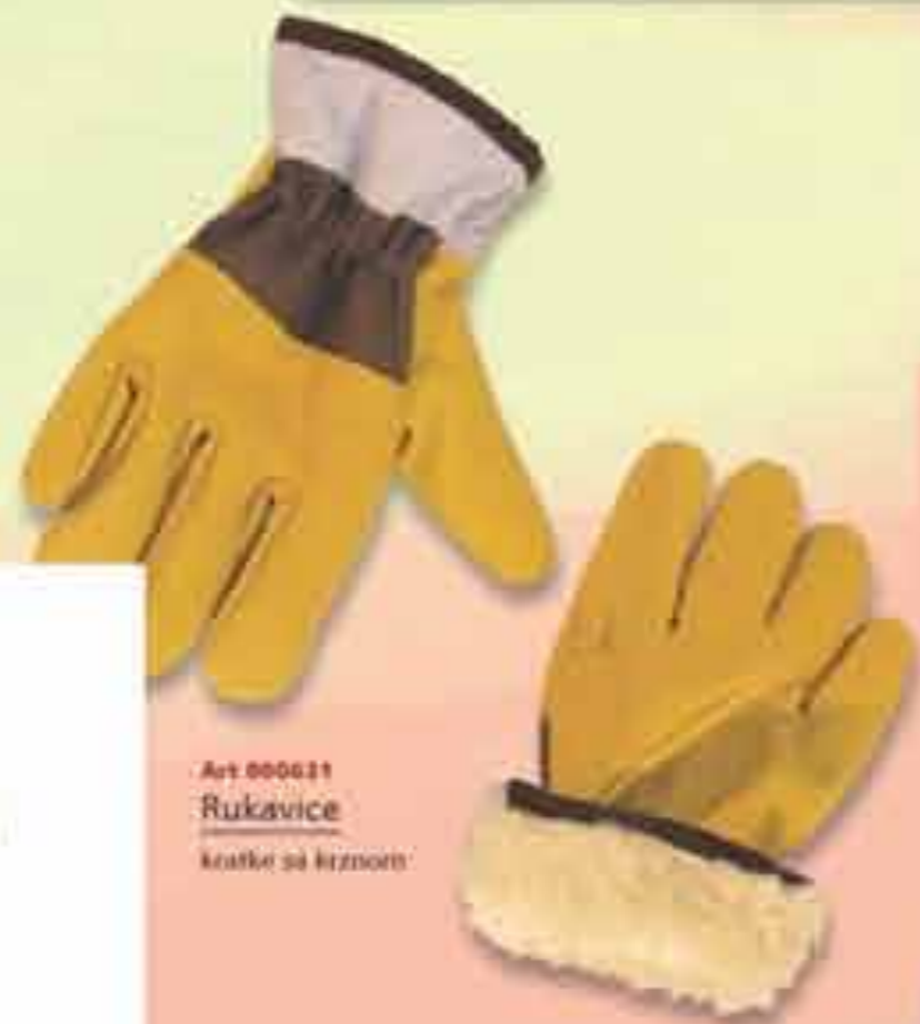
Art 800621 Rukavice kratke sa krznom