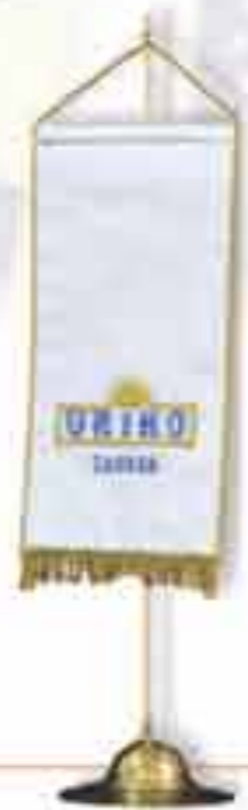
Zastavice stolne, svilene, svečane, vezene