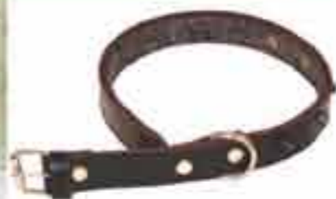
Art 858125 Okovratnik za psa

Izrađuje se u raznim dimenzijama Prirodna koža