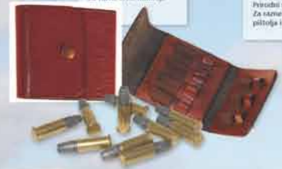
Art 800544 Futrole za pištolje i revolvare Prirodni materijali Za razne vrste pištolja i revolvare