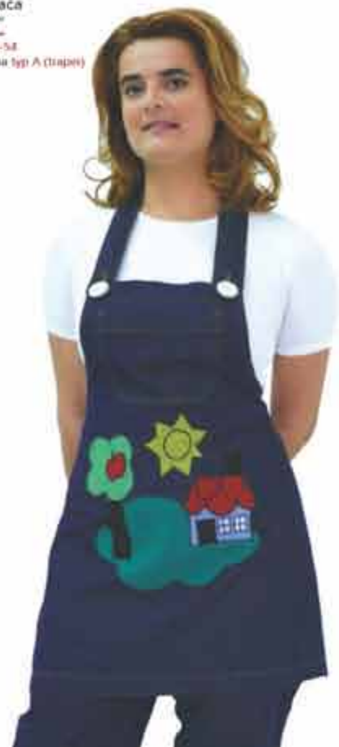
Pregača "Tea" Vel 36-54 Tkanina tip A (trapez)