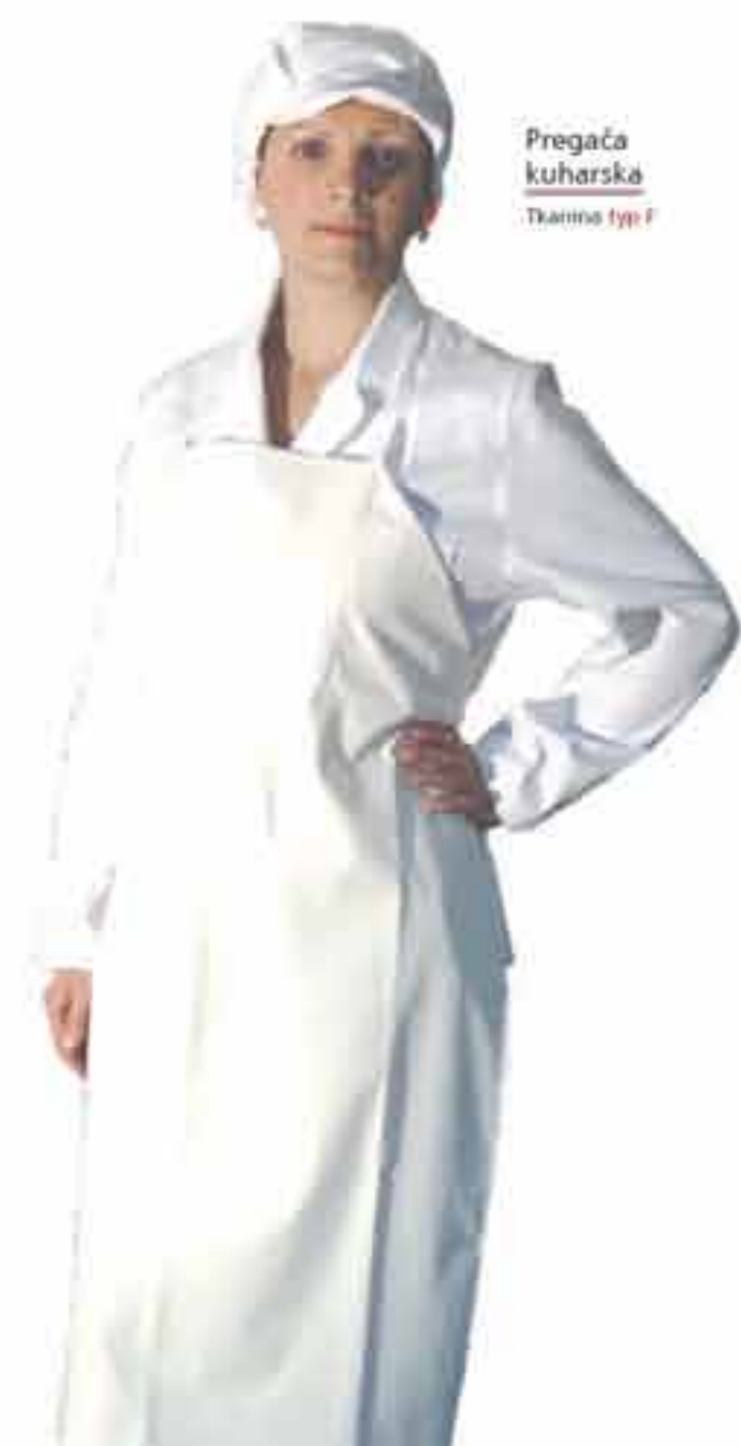
Pregača kuharska Tkanina tip 1