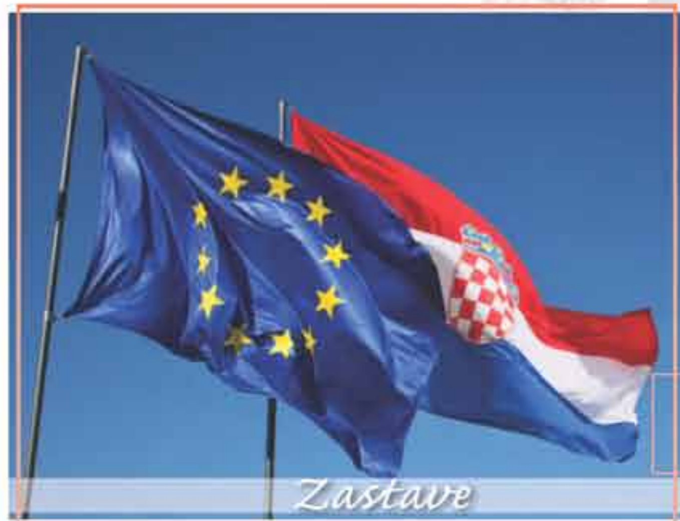
Zastave vanjske, aplicirane