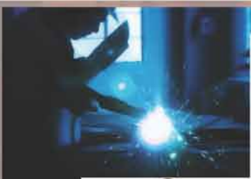
Art 800030 Zaštitno varilačko odijelo Veli 88-62 Prirodna koža