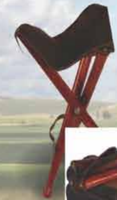
Art 800575 Lovački tronožac Prirodni materijali: drvo, koža