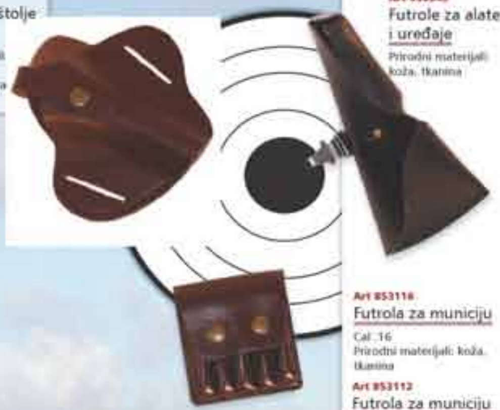
Art 800343 Futrole za alate i uređaje Prirodni materijali: koža, tkanina