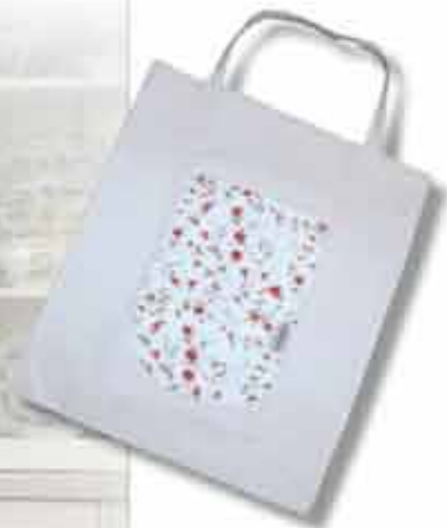
Ručna torba Tkanina tip A