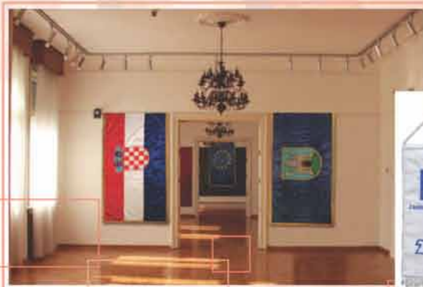
Zastave svečane, svilene, unutarnje