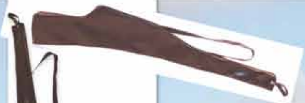
Art 800512 Futrola za lovačku pušku sa snajperom Izrađuju se od prirodnih materijala: koža, tkanina te sintetski materijali