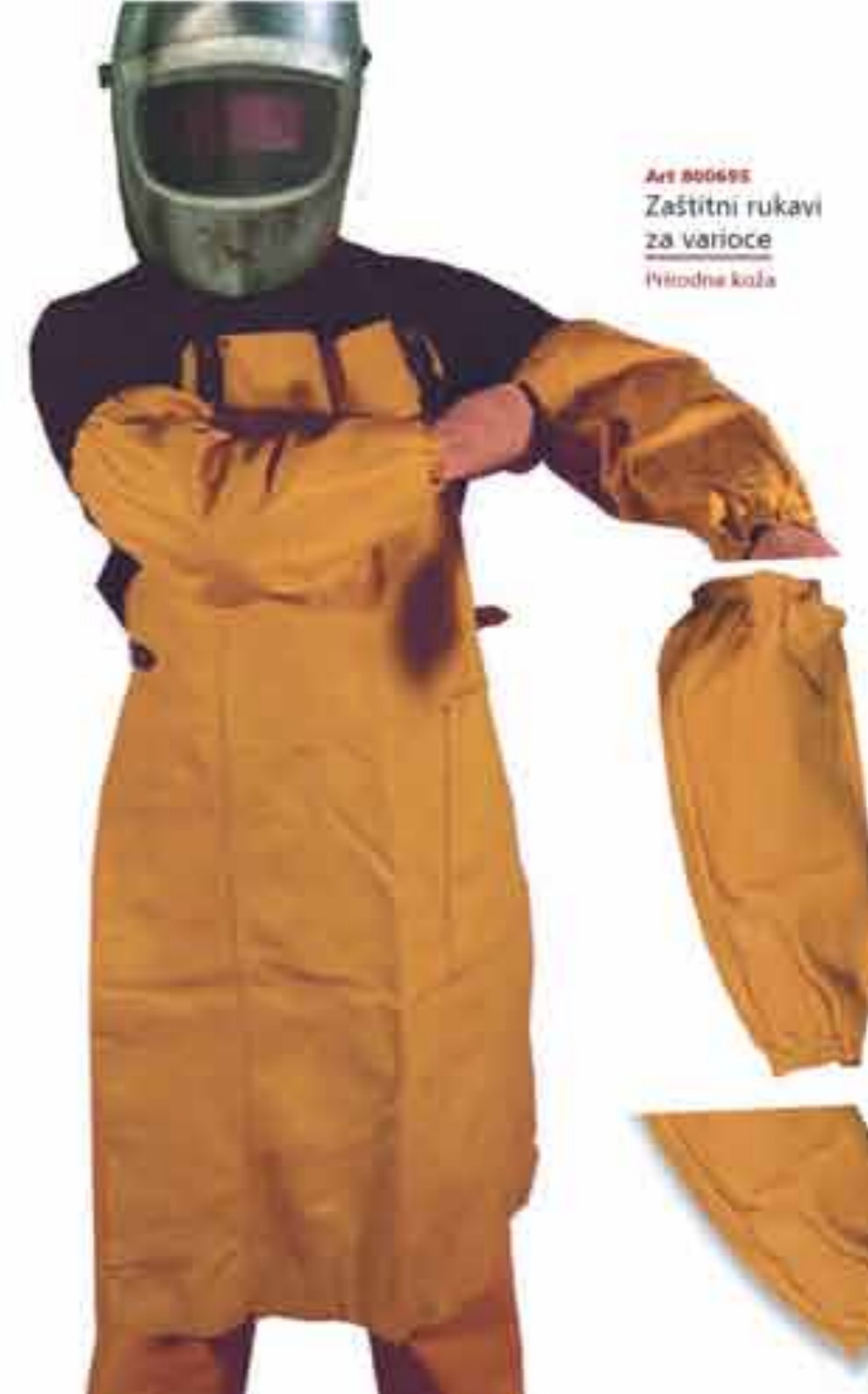
Art 800695 Zaštitni rukavi za varioce Prirodna koža