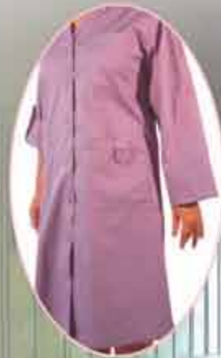
Tunika "Minja" Vel 36-54 Tkanina ty