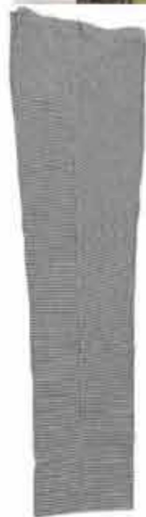
Hlače muške kuharske