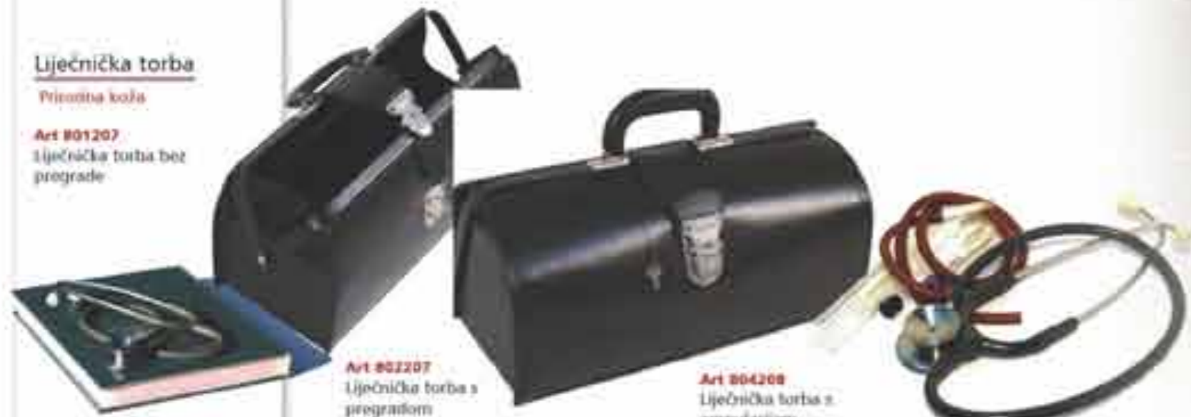
Art 802207 Liječnička torba s progradom