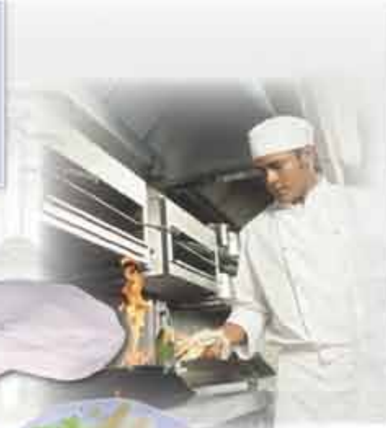
Hlače muške kuharske