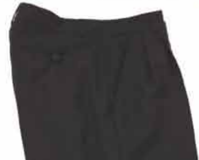
Hlače muške konobarske Vel 46-68 Tkanina tip G