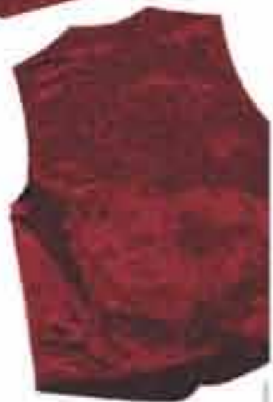
Prsluk muški "Zlatko"