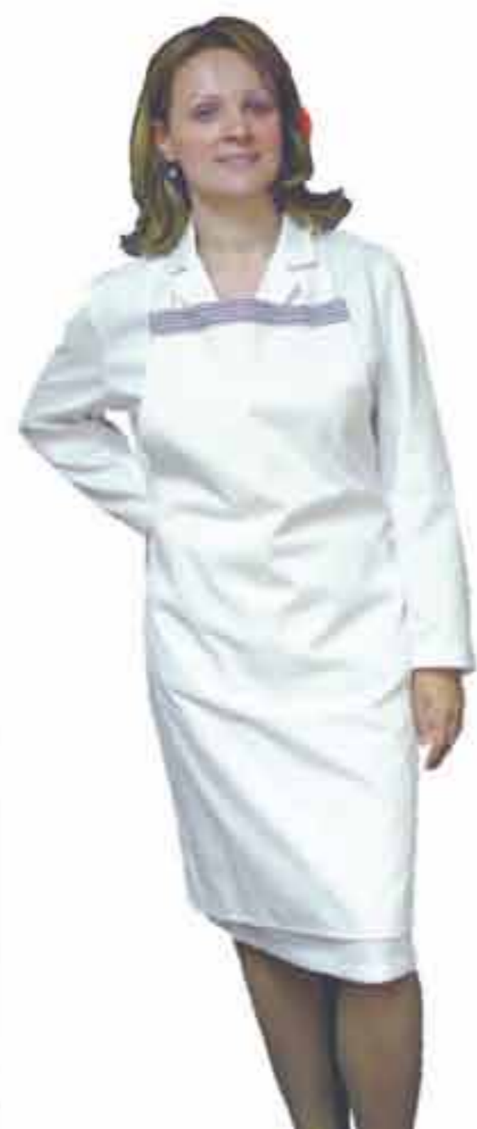
Pregača ženska kuharska Tkanina tip 1