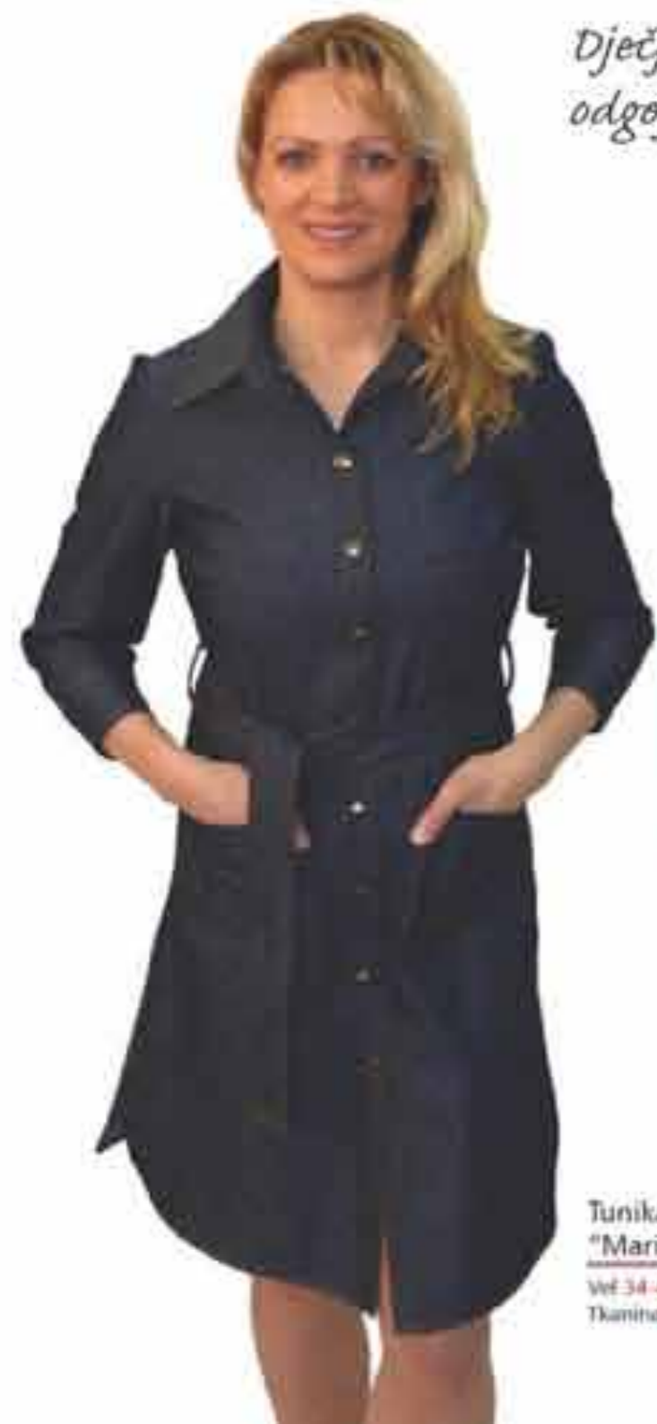
Tunika "Marina" Vel 34-44 Tkanina tip A (trapez)