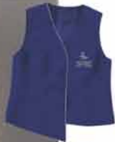
Prsluk ženski "Frankopan" Suknja preklop "Frankopan" Vel 36-44 Tkanina tip G