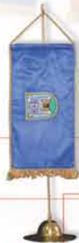
Art. 10000550 Stalac za zastavice Ms