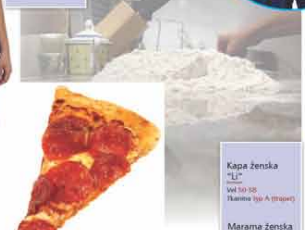
Kapa ženska "Lj" Wl 50-55 Izazina tip A (traper)