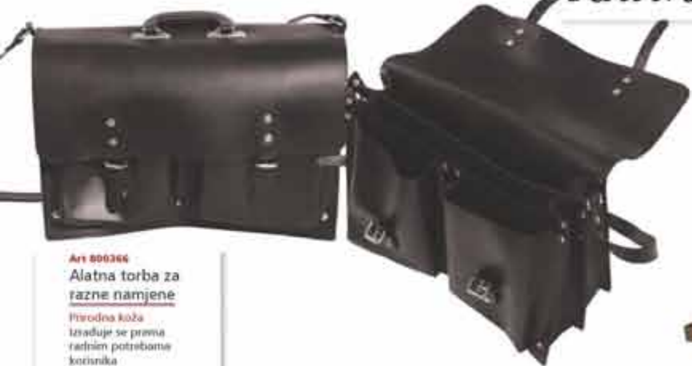
Art 800366 Alatna torba za razne namjene

Prirodna koža Izrađuje se prema radnim potrebama korisnika