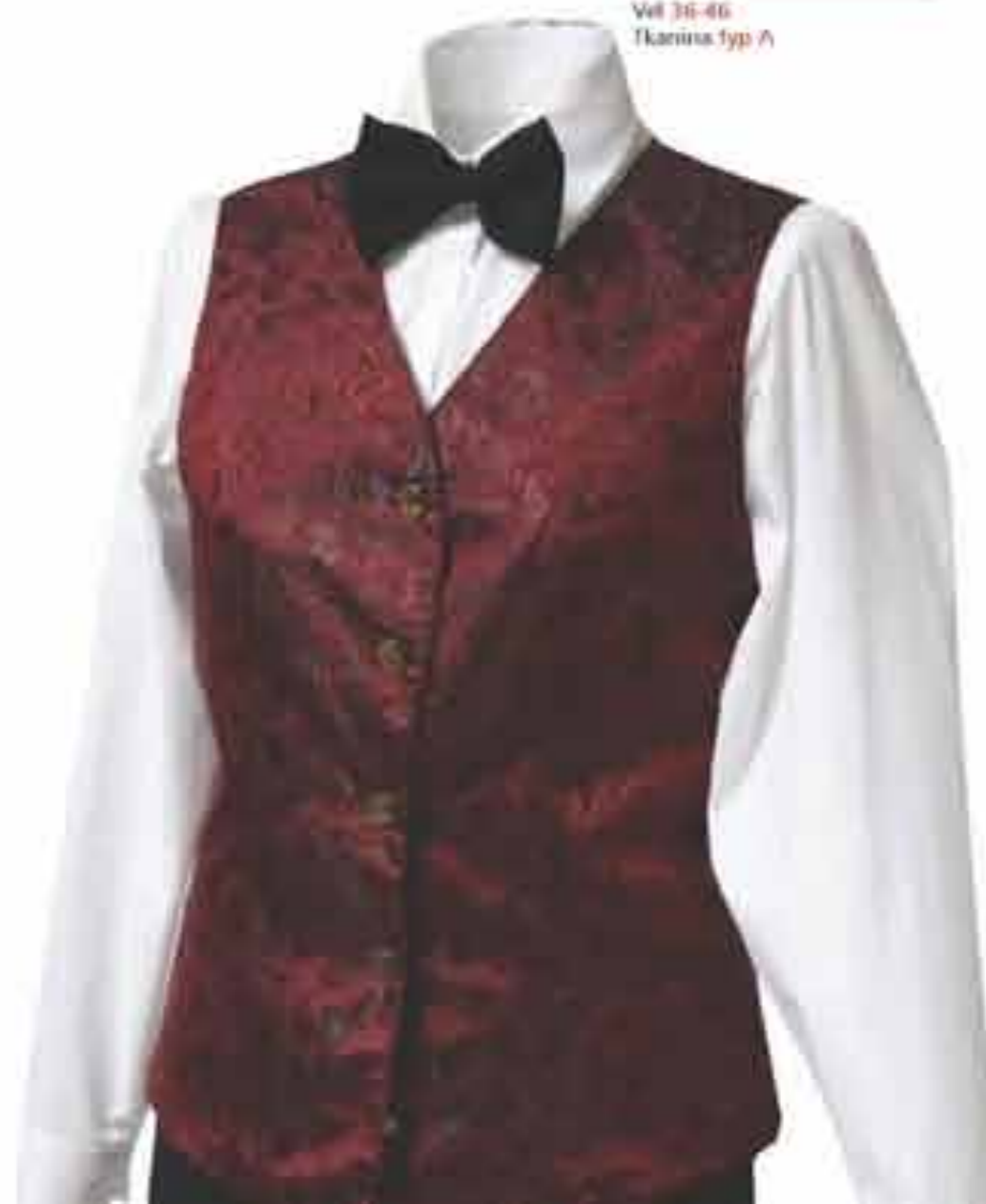
Prsluk ženski "Zlatica"